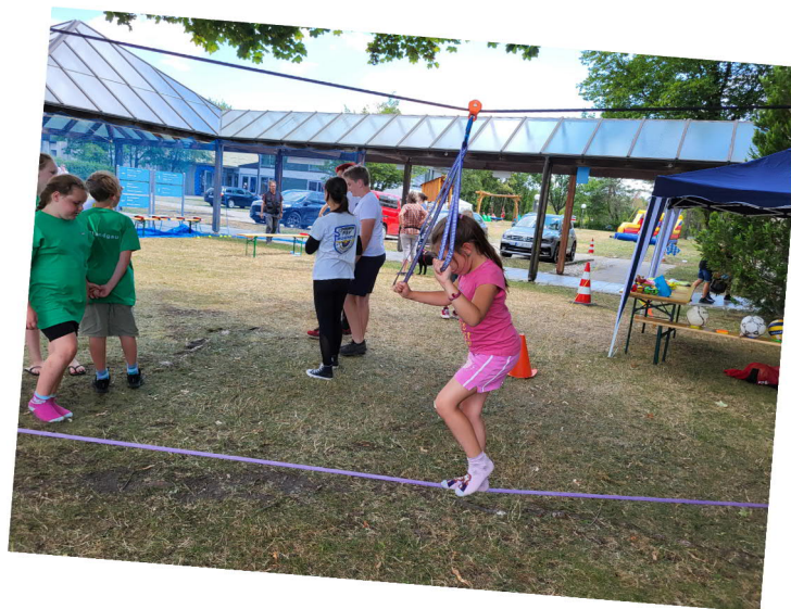
Slag Line mit Spielmobil