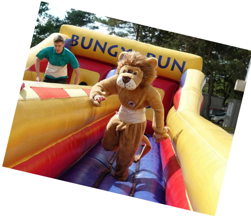
Bungy Run – Auch mit dem Guschu Maskottchen