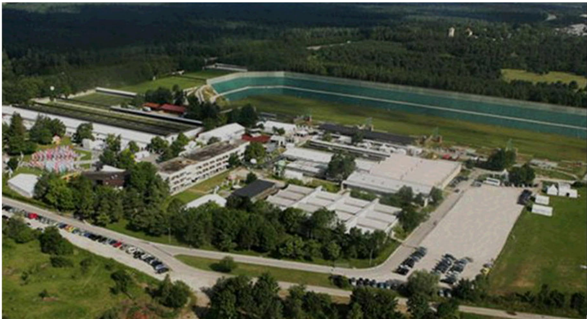
Olympiaschießanlage in München Hochbrück

Nach 2 Jahren „Guschu“ – loser Zeit startete die Jugend der Bergschützen Kühenthal wieder durch. Insbesondere Stand dieser Guschu im Zeichen von Olympia, da die Olympia-Schießanlage, auf der die Guschu-Veranstaltung immer statt findet, damals für die Olympischen Spiele 1972 erbaut wurde und somit ihren 50. Geburtstag feierte.